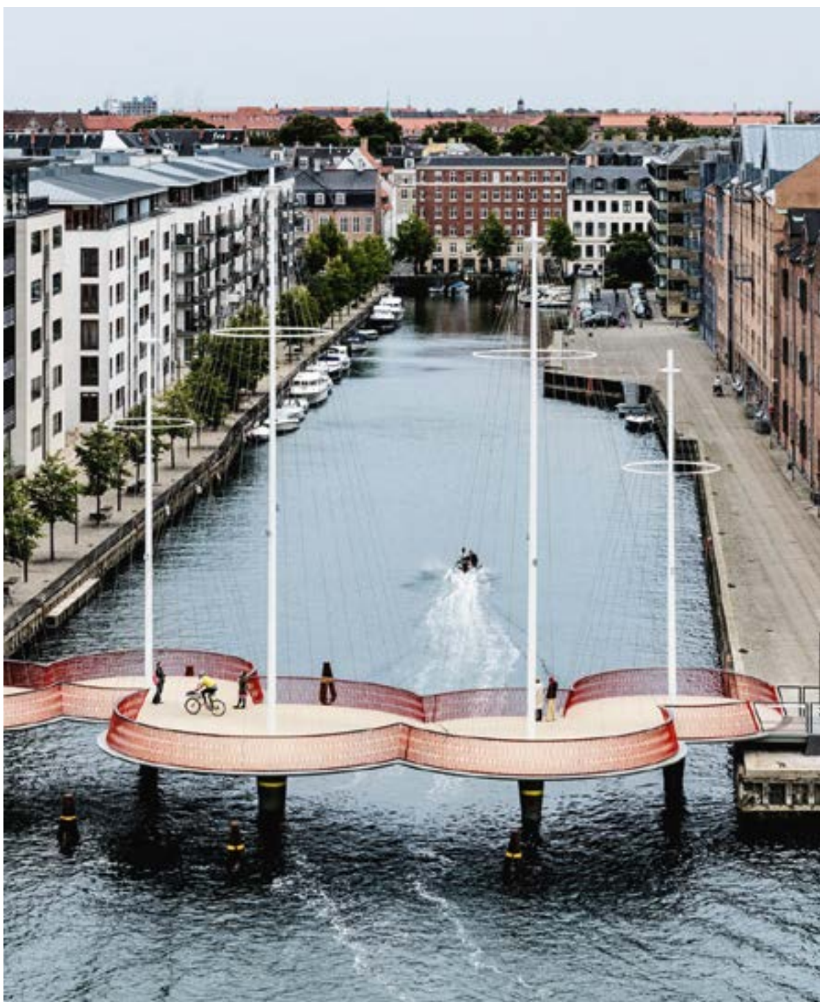
De 'Cirkelbroen' van de Deens-IJslandse ontwerper Olafur Eliasson.