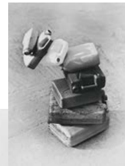
Met de klok mee: Een jonge vrouw, die rond een van de Marie Stella Maris waterbronnen woont. The Fall, stilleven van opgestapelde jerrycans die bij toeval omvielen. Fisherman's Cottage, links rust iemand uit in de schaduw, rechts een berg visjes drogend in de zon.

Met de klok mee: Meisje uit een vissersgemeenschap. Waterteil bij de ingang van een woning. Schoolmeisjes kijken nieuwsgierig toe hoe Bastiaan Woudt hun klasgenootjes fotografeert.