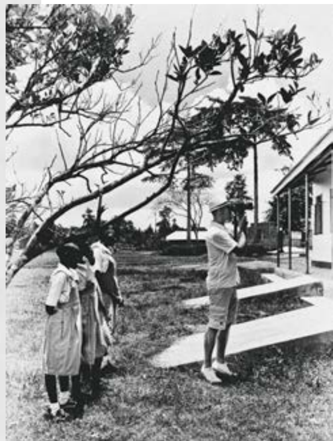
Tekst Natasja Admiraal

Met de klok mee: Meisje uit een vissersgemeenschap. Waterteil bij de ingang van een woning. Schoolmeisjes kijken nieuwsgierig toe hoe Bastiaan Woudt hun klasgenootjes fotografeert.